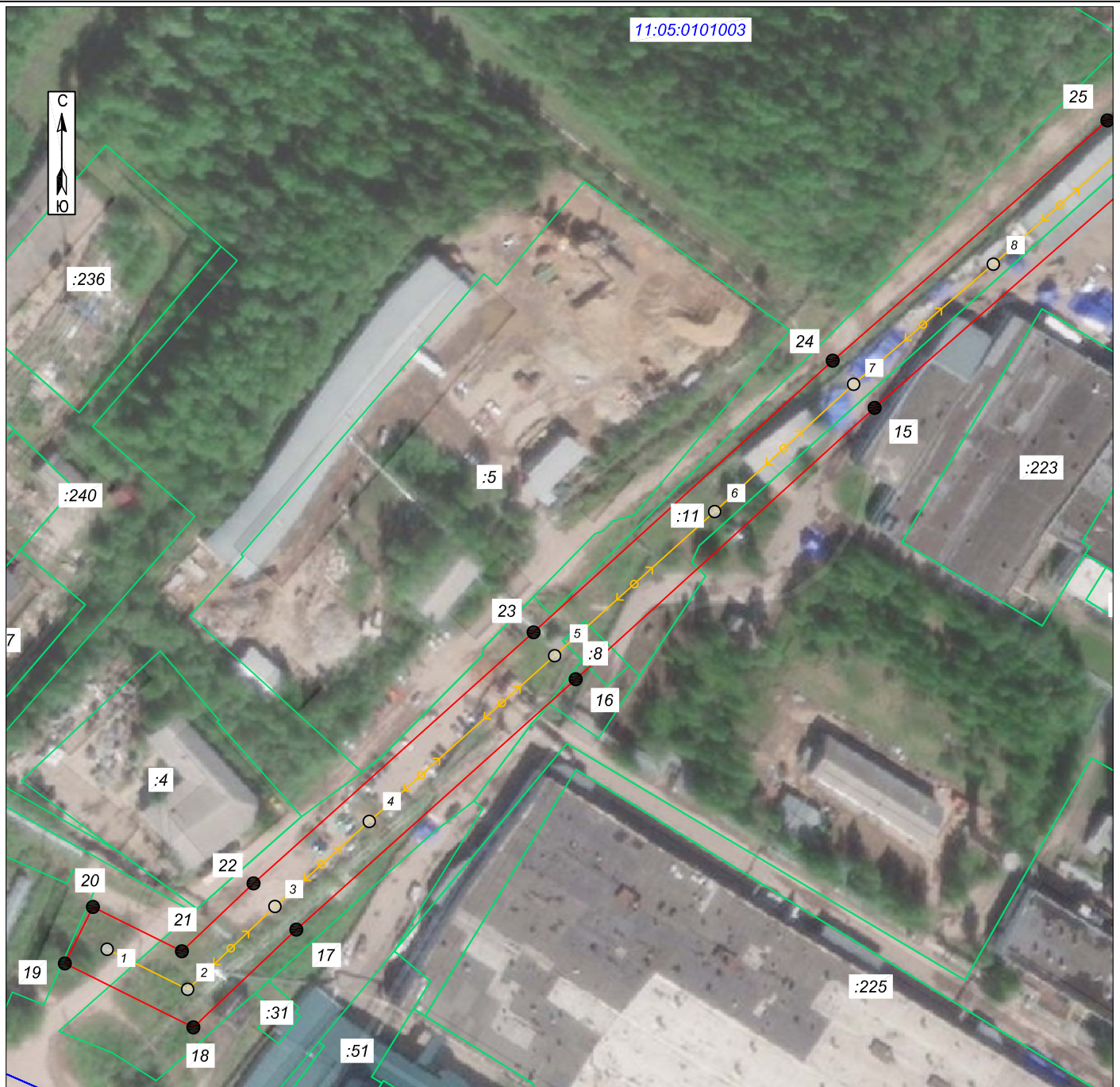
Схема расположения границ публичного сервитута: ВЛ-10КВ ПС "ЧОВЬЮ" Ф.427-ТП-211